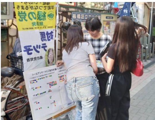
街角のシールアンケートで若者の声を聞く