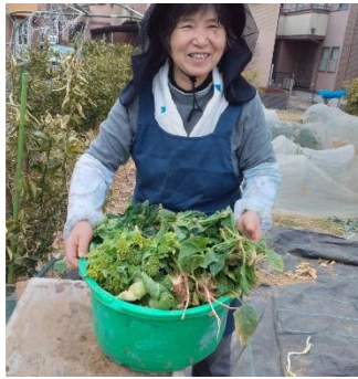
畑でとれた大根やほうれん草！ アスナロ農園の有機野菜はおいしいと好評