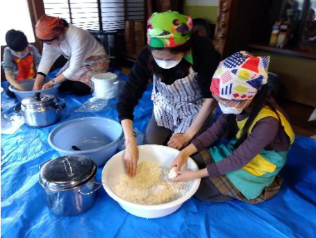
親子で毎年みそづくり

人間の体は食べ物で作られます。農薬や防腐剤、添加物いっぱいの食べ物は健康を損ねていきます。「誰もがタネをまく人になろう！」区民農園や区内の農家さんの畑を借りて野菜づくりをしています。アスナロ農園の有機・無農薬野菜の販売にも取り組んでいます。子どもたちが毎日食べる給食の食材をオーガニックにしていきたい！